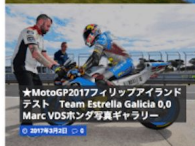
★MotoGP2017フィリップアイランド テスト Team Estrella Galicia 0.0 Marc VDSホンダ写真ガ ラリー