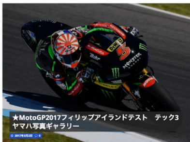
★MotoGP2017フィリップアイランドテスト テック3 ヤマハ写真ギャラリー