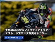
★MotoGP2017フィリップアイランド テスト LCRホンダ写真ガ ラリー